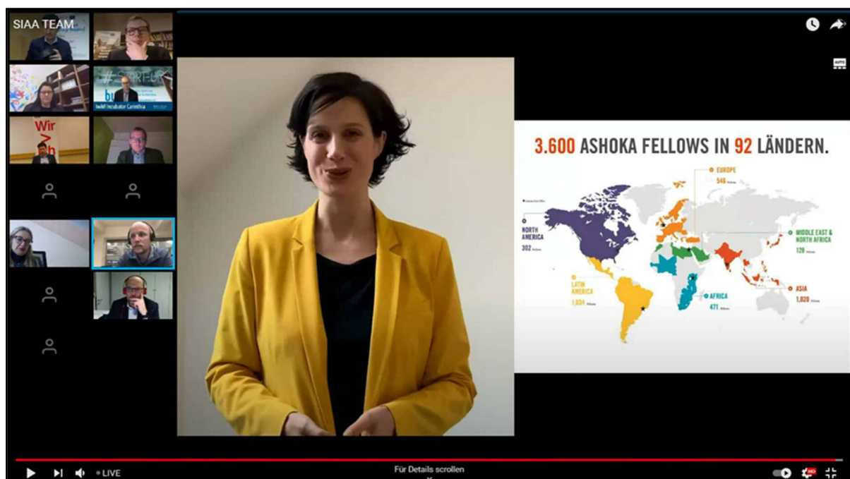
Immagine: Keynote di Marie Ringler, MBA (capo europeo di Ashoka)

In seguito, un progetto di ciascuna delle quattro regioni sostenute dal progetto Interreg è stato presentato sotto forma di breve video. Un altro momento clou è stato il Keynote speech "Everyone is a changemaker" di Marie Ringler MBA, capo europeo di Ashoka, che ha presentato numerosi esempi di buone pratiche di innovazione sociale in Europa.